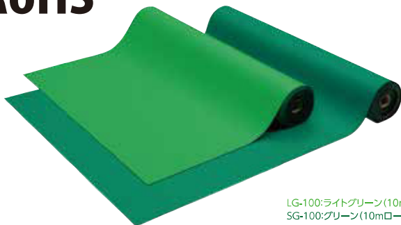
LG-100: ライトグリーン(10mロール) SG-100: グリーン(10mロール)